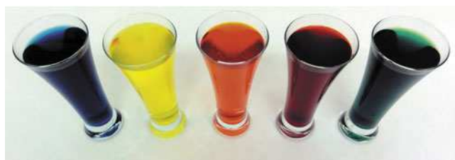
Abb. 2: Aufbau der Station „Wasser sehen und Wasser schmecken“