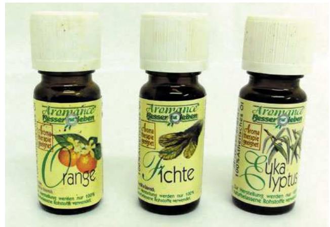
Abb. 7: Duftöle für die Station „Wasser riechen“

Eine weitere Variante wäre das Mitbringen von reinen Wassersorten, wie „Tümpelwasser“, „Schwimmbadwasser“, „Bachwasser“, „Leitungswasser“ etc.