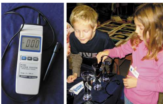
Abb. 4: Mit dem Leitfähigkeitsmessgerät findet die Überprüfung statt

wasser ist Wasser, welches sich unterirdisch über einer wasserundurchlässigen Lehmschicht sammelt. Beim Versickern nimmt das Wasser viele Mineralstoffe auf, welche wichtig für unseren Körper sind. Diese Mineralstoffe fehlen dem Regenwasser. Im Mineralwasser sind noch mehr Stoffe gelöst - es ist ein „altes“ Wasser, welches lange Zeit im Erdinneren verbringt und sehr viel Zeit hat, Stoffe aus dem Erdinneren herauszulösen, bevor es durch eine Bohrung ans Tageslicht gelangt. Es ist immer wichtig, Querverbindungen zu anderen Inhalten zu schaffen, damit die Kinder auch den Sinn und die Zusammenhänge verstehen lernen.