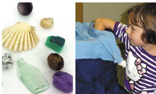
Abb. 6: Gegenstände ertasten im Wasser