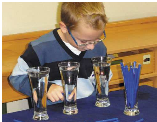
Abb. 3: Wo versteckt sich das Regenwasser?

Im Vergleich zu Erwachsenen erraten Kinder sehr gut, um welches Wasser es sich handelt. Man muss ihnen natürlich Hinweise und Erklärungen geben: „Regenwasser schmeckt eher fad!“ Hier kann man sehr gut eine Verknüpfung zum Wasserkreislauf herstellen. In Österreich bekommen wir unser Leitungswasser v. a. aus dem Grundwasser. Grund-