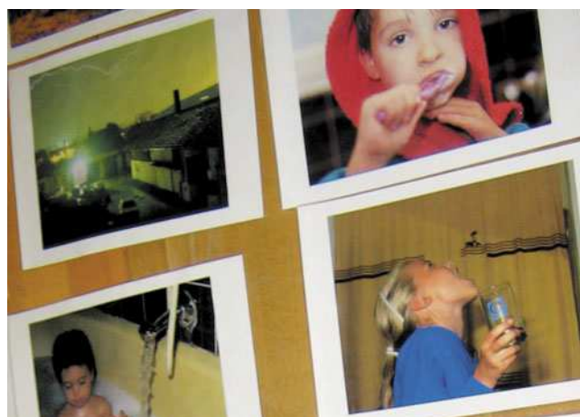
Abb. 5: Zuordnen von Geräuschen zu Bildkarten

Zur Festigung des Hörens eignet es sich auch sehr gut, Kinder in Kleingruppen mit einem Diktiergerät und dem Auftrag „selbst Wassergeräusche aufzunehmen“ loszuschicken. Diese entsprechen der Lebenswelt der Kinder und sind auch für andere Kinder gut zu erkennen. Die Gruppen spielen sich dann gegenseitig die Wassergeräusche vor und eine abwechselnde Raterunde kann durchgeführt werden.