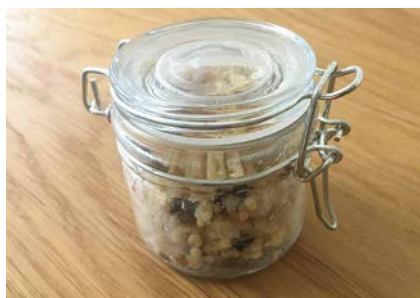
Drahtbügelgläser schließen sehr gut, eignen sich für größere Kinder