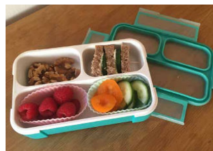
Eine stabile Jausenbox mit Fächern und gutem Verschluss