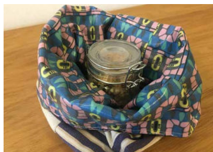
Jausenbeutel aus beschichtetem und dadurch waschbarem Stoff, falls etwas ausrinnt